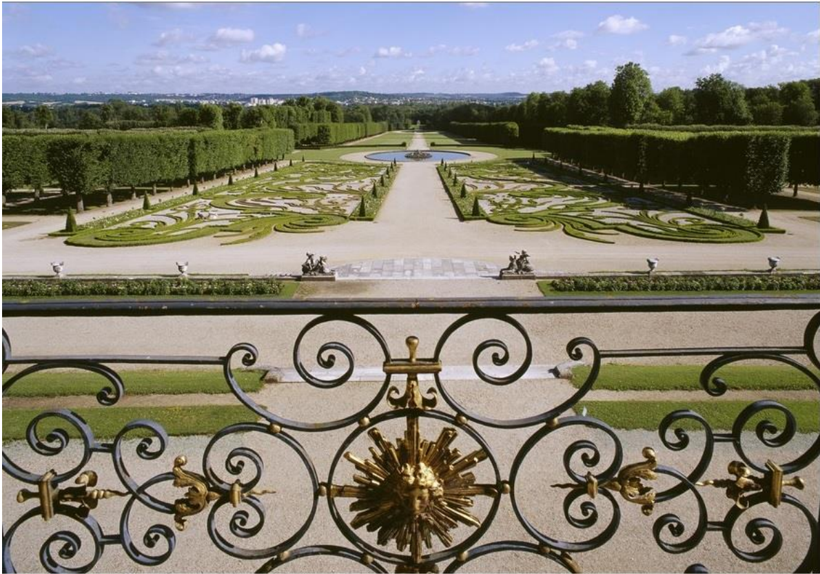
3 – Parc du château de Champs-sur-Marne