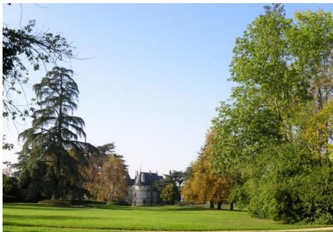
1 - Parc de Chaumont-sur-Loire Henri Duchêne

Les journées Henri et Achille Duchêne 12, 13 & 14 novembre 2015