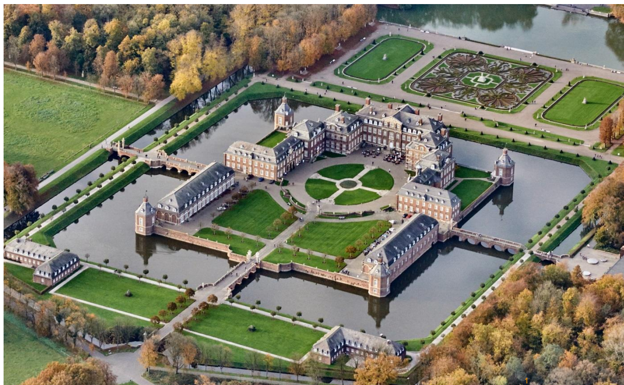
6 – Château de Nordkirchen (Rhénanie-du-Nord-Westphalie)

Les journées Henri et Achille Duchêne 12, 13 & 14 novembre 2015