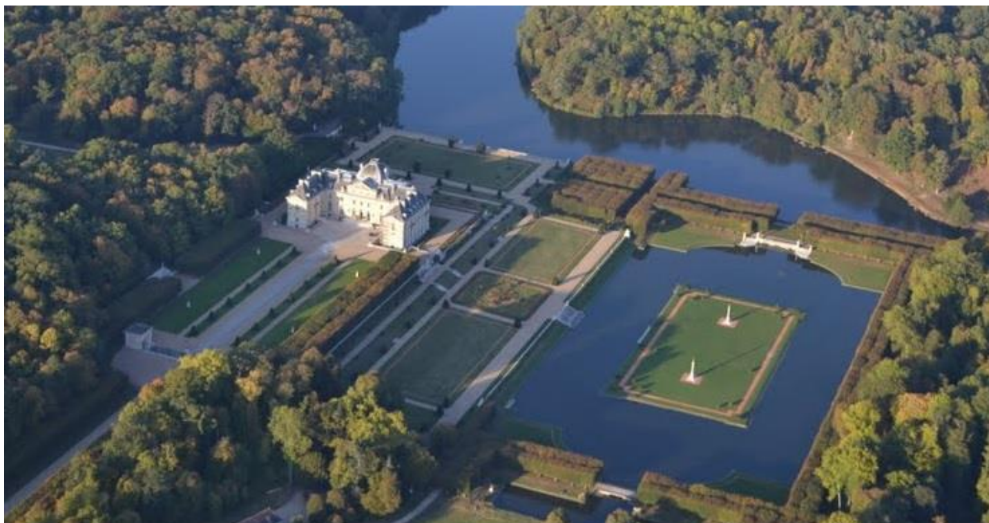
4 – Château de Voisins, Saint-Hilarion (Yvelines)