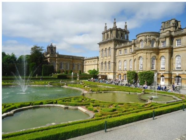
2 - Parterre d'eau, Blenheim Palace Achille Duchêne

Les jardins des architectes-paysagistes Henri et Achille Duchêne sont devenus de véritables icônes de l'histoire de l'art, qu'il s'agisse du parc de Chaumont-sur-Loire ou des parterres de Champs-sur-Marne, des précieuses broderies du parc de Vaux-le-Vicomte ou, encore, du parterre d'eau créé devant la grande façade baroque du palais de Blenheim en Angleterre.