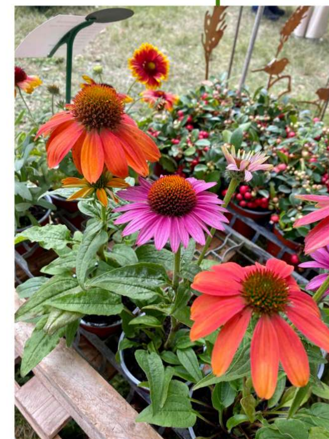
Fleurs en Seine

Buddleia (arbre à papillons), Aubépine, Framboisier, Groseillier, Lavatère, Ronce (mûrier sauvage)