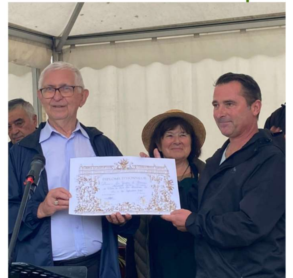
Boca Plantes et Jardin d'Eaurus