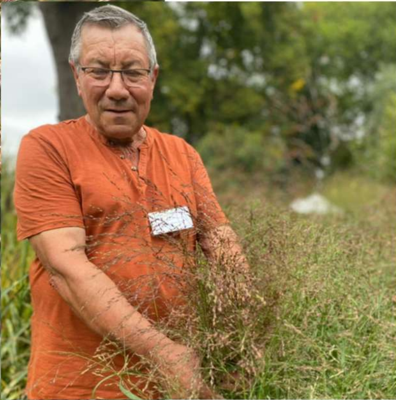
Red Chief et Pépinière Amary

3ème prix : Association Les jardins du Rouillard