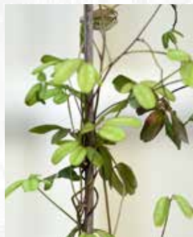
Akebia trifoliata x longeracemosa