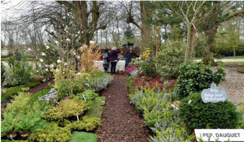
Stand de la Pépinière Dauguet