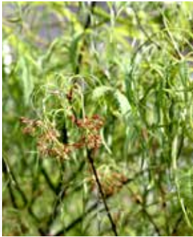
Acer palmatum 'Koto no Ito'

Pépinière Choteau pour Acer palmatum 'Koto no Ito'