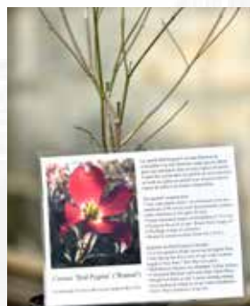
Cornus 'Red Pygmy'