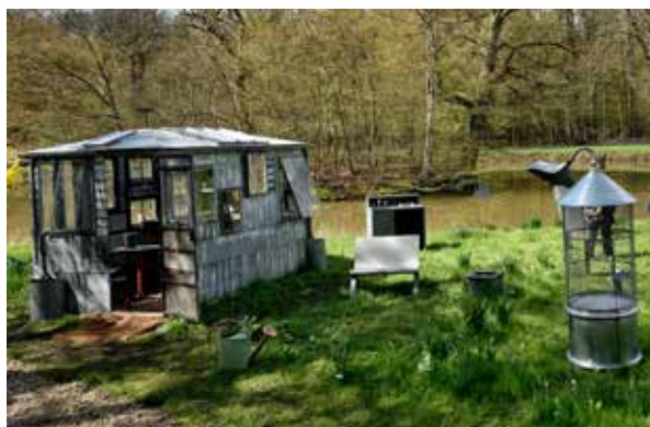
Arzinc présente son refuge au jardin

Parmi les créations d'Arzinc, son refuge a été particulièrement apprécié du public de la Fête des Plantes. L'abri idéal des jardiniers les plus passionnés, l'hiver comme l'été !