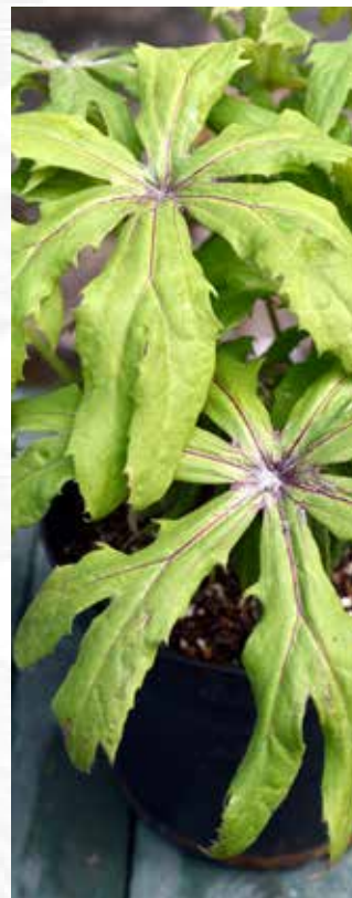
Syneilesis palmata 'Shishi'

Décerné par la Section Plantes Vivaces, le Prix de la Société Nationale d'Horticulture de France récompense une plante vivace de collection d'intérêt botanique/horticole.