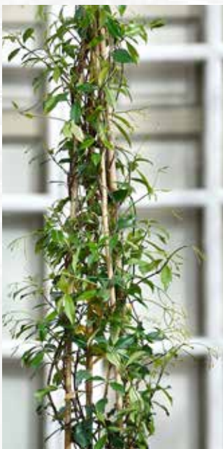
Trachelospermum asiaticum 'Pink Shower'

Attribué par un jury de représentants de la presse jardin et de journalistes horticoles, le Prix de la Presse récompense une plante justifiant une communication écrite ou audiovisuelle importante auprès du grand public.